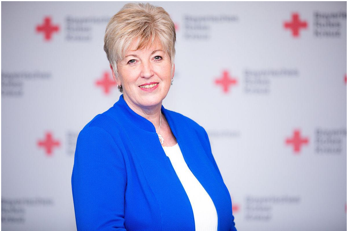
Abbildung 2: Angelika Schorer – BRK-Präsidentin